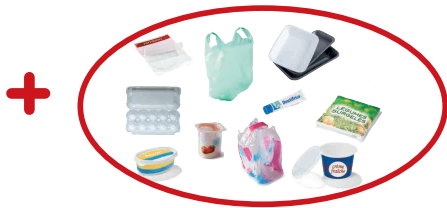
Tous les autres emballages en plastique